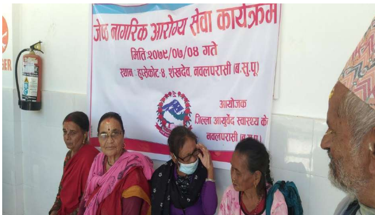
जेष्ठ नागरिक आरोग्य कार्यक्रम