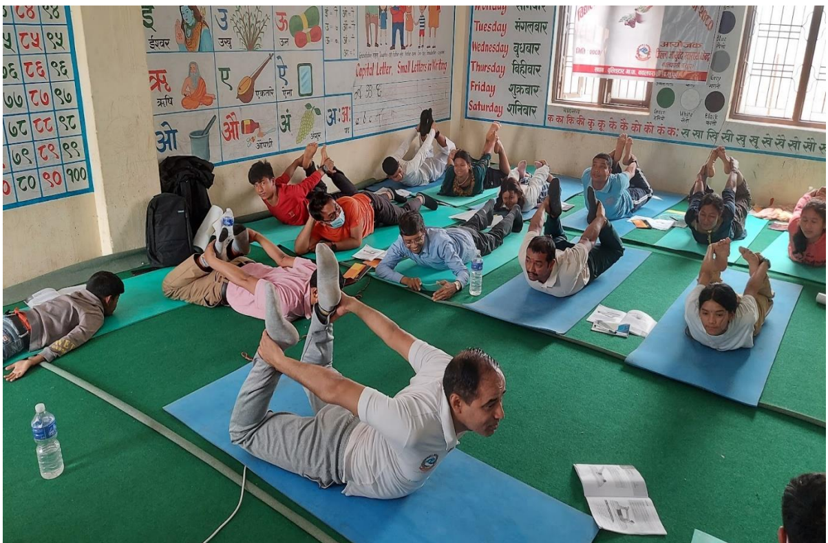
विद्यालय आयुर्वेद तथा योग शिक्षा