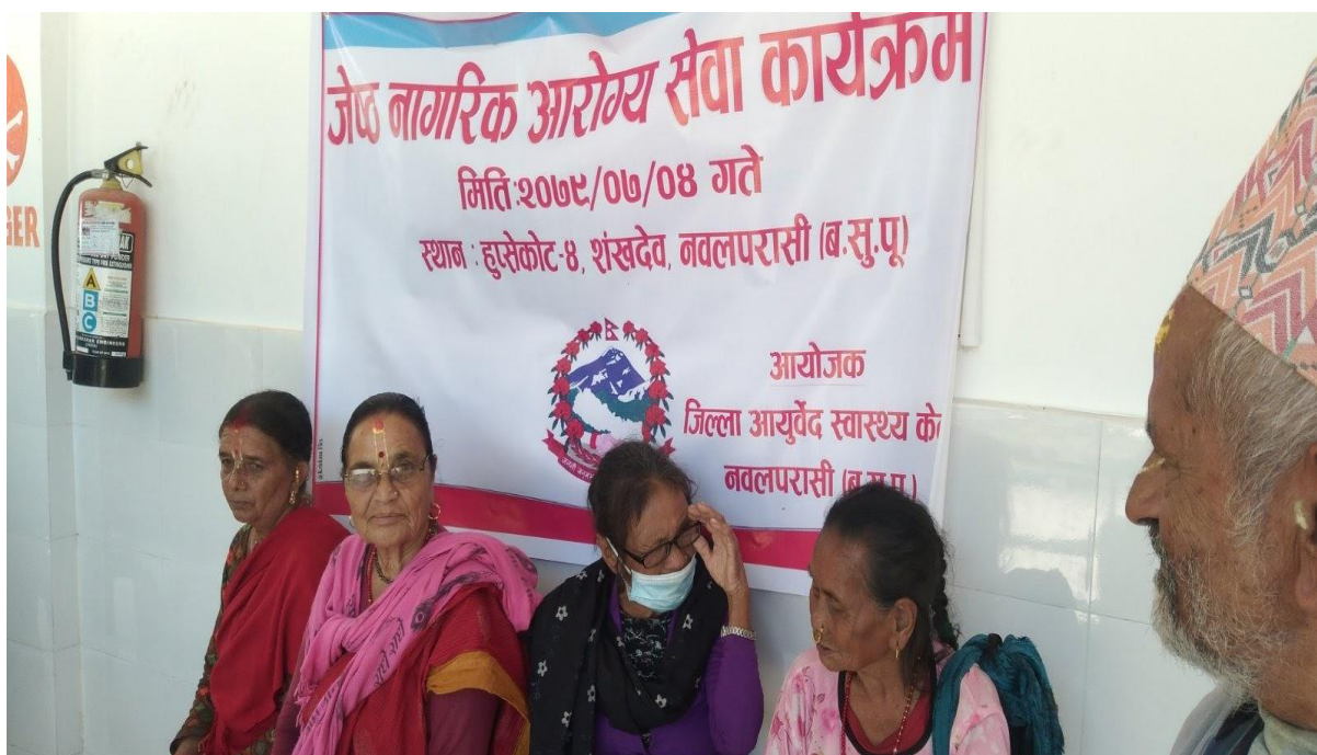
जेष्ठ नागरिक आरोग्य कार्यक्रम